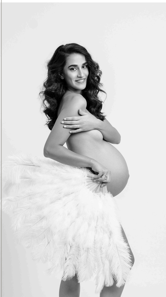
© Sandra DA SILVA, Portraitiste de France Honneur 2025. Major de promotion.

Le titre obtenu est strictement nominatif et ne peut en aucun cas être attribué à l'entreprise. Le candidat doit être l'auteur exclusif des photographies présentées.