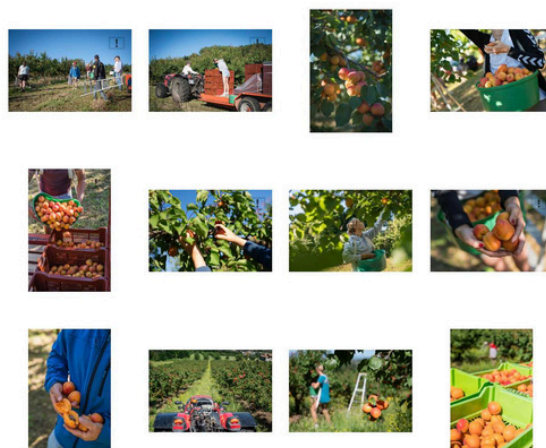
Exemple de planche contact

5 Le candidat doit également fournir un fichier numérique anonyme : une planche-contact fond blanc , format paysage (1920x1080 px), regroupant toutes les images du dossier dans l'ordre de numérotation des sujets.