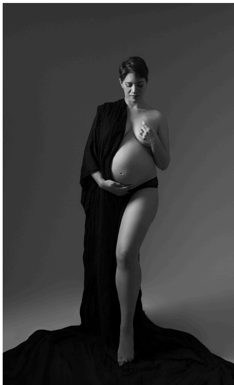
© Tony Rapiteau, Portraitiste de France Honneur 2025.